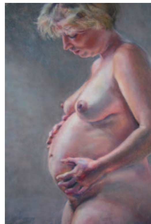
'Samen' (2005), pastel, 66 x 48 cm.