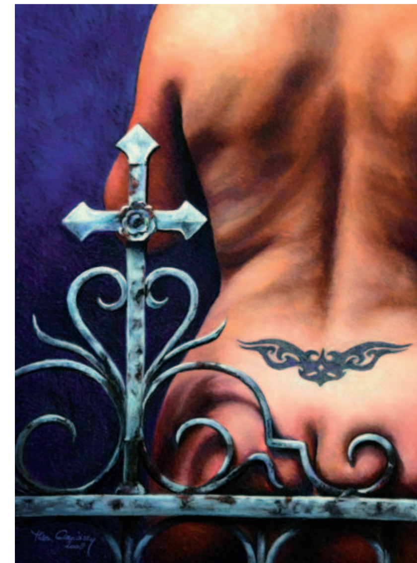
'Tribal' (2008), pastel, 60 x 45 cm.

van vier weken. 'Van hem heb ik het bepalen van een goede gelijkenis en het werken van donker naar licht geleerd. De portretten die ik in Amerika maak, zijn allemaal puur naar waarneming. Je kunt alles met foto's doen, maar de basis blijft waarneming.'